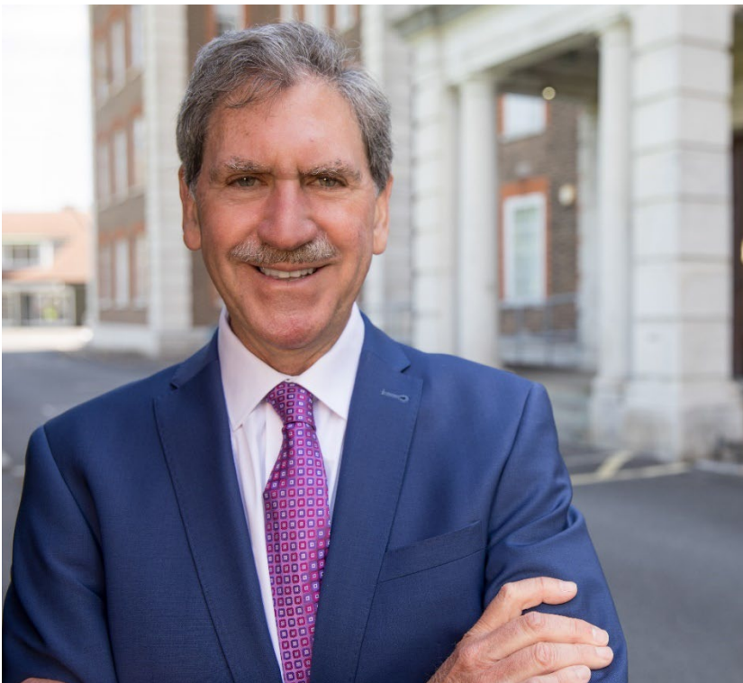
David Haggerty El Presidente de la ITF

Esta Política, vinculada con la protección de todos los Adultos, establece nuestros estándares y las expectativas de todos nosotros en la ITF y todos los que participan en sus actividades.