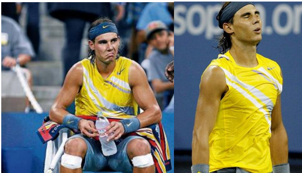
Rafael Nadal, en dos momentos de duda y decepción

Sin duda que el juego del tenis es quizás uno de los juegos más psicológicos, y que por tanto nuestro lenguaje corporal, nuestro estado de ánimo se ve afectado por el marcador, pero los grandes jugadores no se dejan “derribar” por un 4-1 abajo o por un set perdido, no dejan que su rival observe en ellos un lenguaje corporal de “derrota” y “sumisión” hacia el marcador, ellos siguen jugando punto a punto, hasta el final del partido, esperando que llegue su momento y si no llega ese día, felicitan a su rival y esperan el siguiente partido.