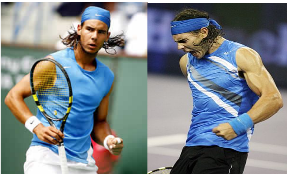
Rafael Nadal: Confianza y agresividad

Evidentemente, todos los jugadores de tenis pasan por malas rachas, nadie se escapa de momentos difíciles, de días donde sin saber porque anímicamente no estas al 100%, nos pasa a todos en nuestra vida diaria, por eso es tan difícil poder expresar todos los días un lenguaje corporal de seguridad y confianza, porque cada día es diferente al anterior, y el jugador-persona debe controlar sus emociones para conseguir la mayor de las predisposiciones hacia la competición.